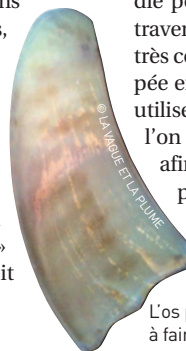
L'os poli qui sert à faire gua sha